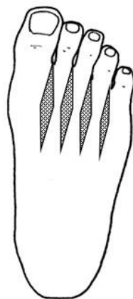
Figura 2 Áreas correspondentes à circulação sanguínea e linfática na reflexologia podal. Fonte: Adaptada de Lourenço (2011).

Na maioria dos pacientes com gastrite crônica, é necessário realizar um tratamento antibacteriano, em função da presença da bactéria H. pylori no estômago (GUYTON; HALL, 2002; KUMMAR; ABBAS; FAUSTO, 2005). Dessa forma, a reflexoterapia pode complementar o tratamento a fim de potencializar seu poder de cura e aumentar a imunização do paciente, auxiliando na defesa do organismo contra a bactéria. É recomendada a estimulação das áreas de prevenção anti-inflamatórias e, neste caso, de áreas referentes ao sistema imunológico, como glândulas linfáticas, que, segundo Wen e Kuabara (2010), são indicadas para qualquer tipo de inflamação e para aumentar a capacidade de defesa do organismo (Figura 2).